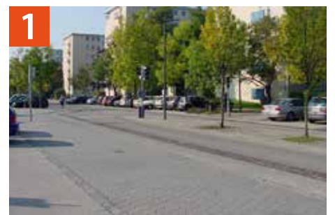
Fußgängerampel Am Stutenanger