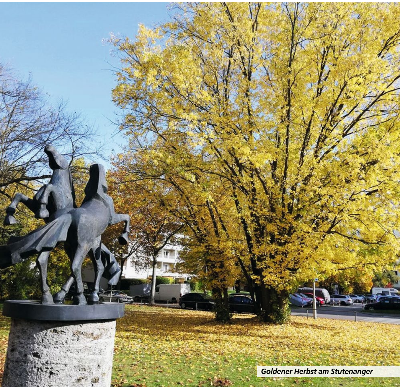
Goldener Herbst am Stutenanger

Bekanntmachungen und Mitteilungen der Gemeinde Oberschleißheim mit den Gemeindeteilen Badersfeld, Mittenheim, Lustheim, Hochmutting und Kreuzstraße