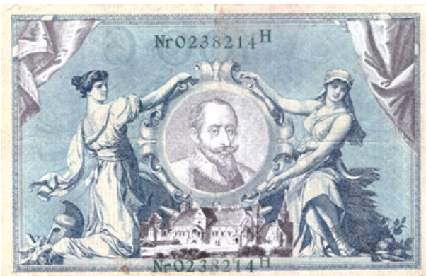
Herzog Wilhelm V. und das Alte Schloss Schleißheim

Start bzw. Treffpunkt ist um 14.00 Uhr das Rathaus an der Freisinger Straße. Endpunkt soll jenseits des Mühlbachs das ehemals Königl. Bayer. Brauhaus sein, von dem noch sehr viel erhalten ist. Dauer ca. 1 ½ Stunden. Die Teilnehmergebühr beträgt 3 Euro. Dafür erhält jeder „Mitläufer“ einen historischen Ortsplan und einen „süffigen Abschluss“. Für Mitglieder der „Freunde von Schleißheim“ frei.