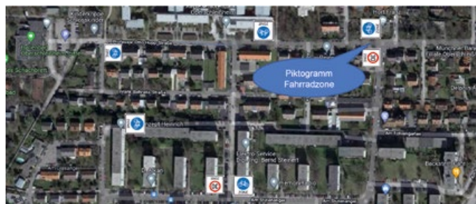
Fahrradzone in der Prof.-Otto-Hupp-Str.

Weitere Fahrradstraßen wurden daher eingerichtet. In zwei Fällen ergab sich bei der Umsetzung jedoch die Erkenntnis, dass die Fahrradzone das geeignetere Mittel ist, um das Miteinander aller Verkehre abzubilden. Die Begründungen sind im Detail im Ratsinformationssystem der Gemeinde Oberschleißheim zur Sitzung des Umwelt- und Verkehrsausschusses am 5. April zu finden (Pfad: https://oberschleissheim.ratsinfomanagement.net/termine ).