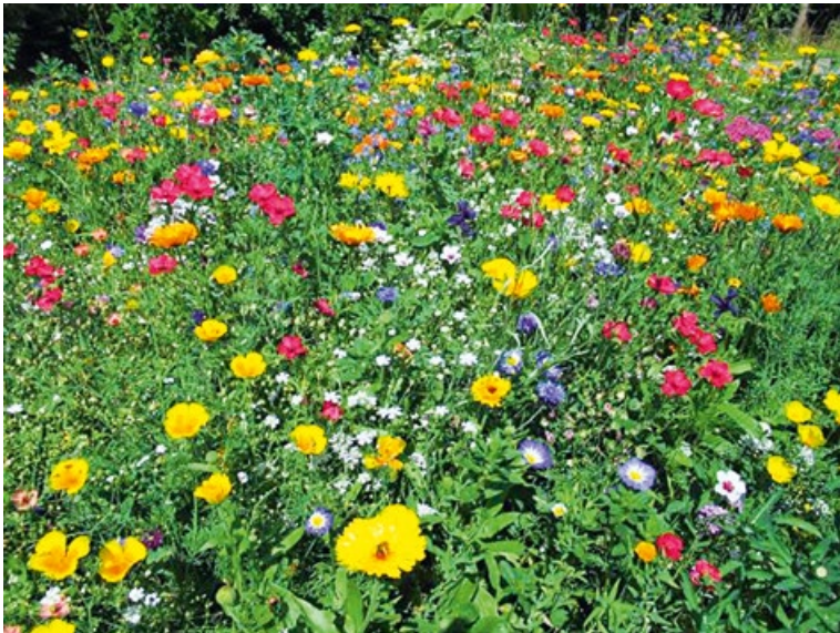
Blumenbeet am Gänsbach: Eine Freude für Mensch und Tier

Danke an alle (Hobby-)Fotografen und Gartenfreunde!