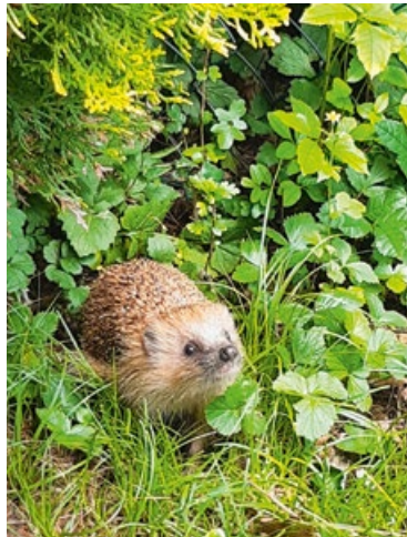
Was für ein Prachtkerl: Der Igel im eigenen Garten