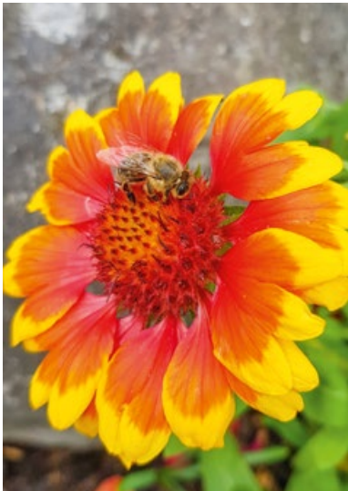
Biene & Blume vor der Haustür