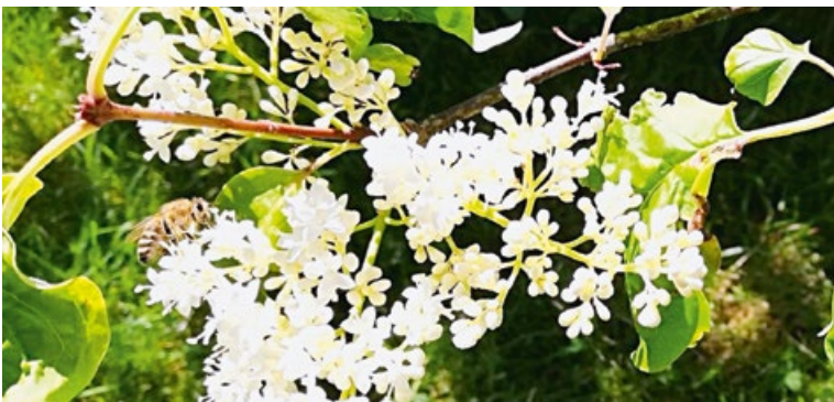
Honigbiene am Japanischen Flieder