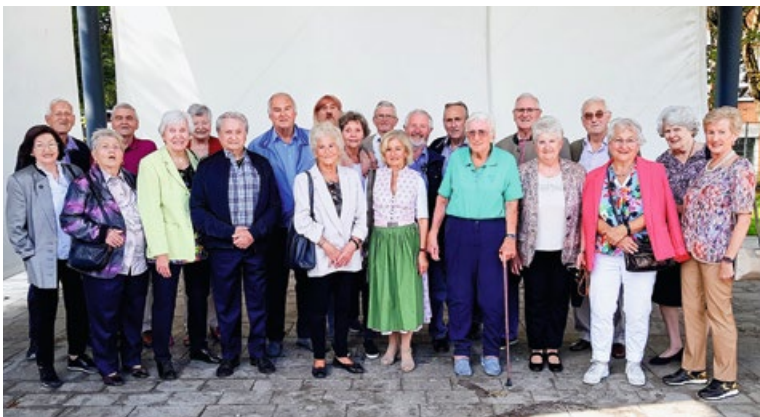
Gruppenaufnahme des 8. Klassentreffens