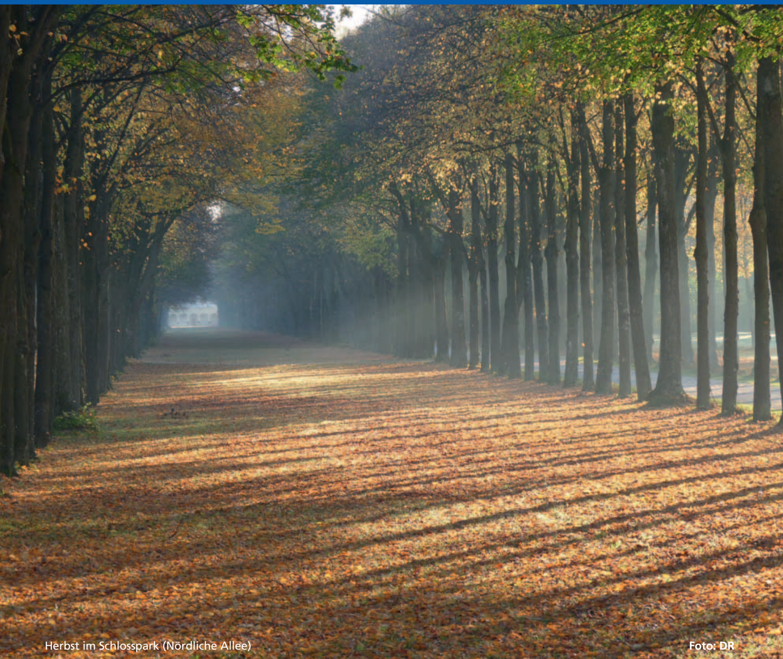
Herbst im Schlosspark (Nördliche Allee)