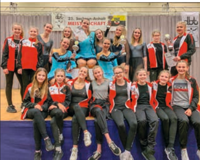
JazzADa Teenies und Senioren in Merseburg

Am frühen Nachmittag zeigten die jüngeren Tänzer und Tänzerinnen ihr Können und auch die Senioren begeisterten die Jury mit tollen Choreografien. Durch beeindruckende Tanzeinlagen wurde die Halle ordentlich eingeeicht und das Publikum war sichtlich begeistert. Bei allen Performances war eines klar ersichtlich: Alle Teilnehmer – Tänzer wie Trainer – haben seit dem letzten Wettkampf hart an sich gearbeitet. Am Ende gab es für die Schleißheimer fünf 1. und einen 3. Platz im Qualifikationsturnier.