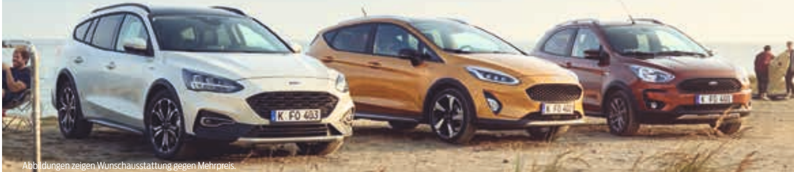
Abbildungen zeigen Wunschausstattung gegen Mehrpreis.