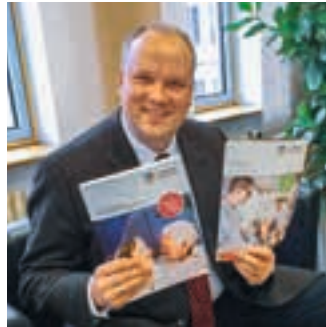
Präsentiert das neue Nachschlagewerk für Seniorinnen und Senioren im Landkreis: Landrat Christoph Göbel.

Zahlreiche Freizeit- und Bildungsangebote, eine Auflistung aller Beratungsstellen sowie Informationen zu den Themen Wohnen, Ernährung und vieles mehr: Der druckfrische „Seniorenratgeber für Älter werdende und Junggebliebene“ ist ein umfassendes Nachschlagewerk mit zahlreichen Adressen und Tipps für Seniorinnen und Senioren im Landkreis München.