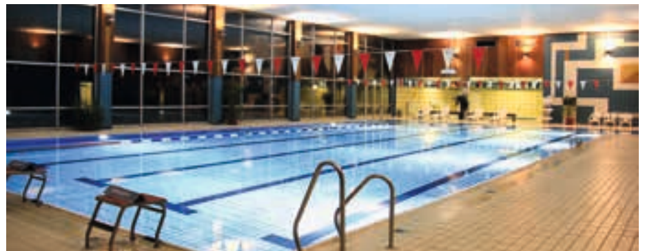
Hallenbad Oberschleißheim (Info: Am Faschingsdienstag geöffnet – Kinder haben freien Eintritt – Spielesachmittag 14–17 Uhr)