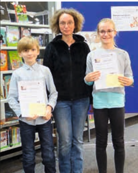
Die fleißigsten jungen Leser im Jahr 2018.

Traditionell findet im Januar immer das Preisrätsel der Bücherei für Schüler von 6 – 16 Jahren statt. Dieses Jahr stand es unter dem Motto „Schatzsuche“.