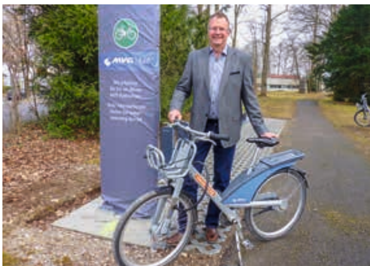
Erster Bürgermeister Christian Kuchlbauer an der MVG-Mietradstation am Schloss.