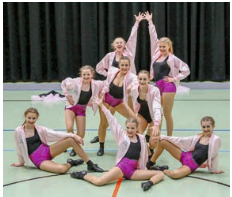
Teenies mit ihrem Modernen Schautanz

Nach diesen erfolgreichen Deutschen Meisterschaften ist beim Saisonfinale bei den Europameisterschaften am 1. Juni in Merseburg für Spannung gesorgt. Die Tänzerinnen warten jetzt schon gespannt auf ihre Konkurrenz aus Österreich und Ungarn.