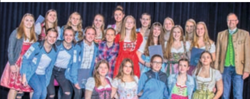
Die (anwesenden) Damen-Beachhandball-Mannschaften des TSV Schleißheim (wA Jugend, wB Jugend, wC Jugend, wU17)

Professor u. Lehrerin aus Ulm suchen für ihren Sohn eine 1-Zimmer-Studenten-Wohnung ab Sept. 2019 mit guter öffentlicher Anbindung zur TUM. Tel. 0731 / 2806911