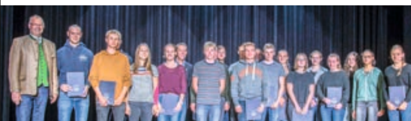
Die (anwesenden) geehrten Ruderer der Rudergesellschaft München 1972