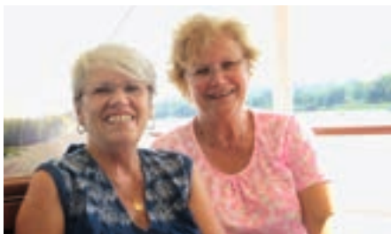
Unsere beiden Betreuer unterwegs auf See

Genießen Sie die malerische Landschaft rund um den Kochelsee, mit dem Walchenseekraftwerk und den beeindruckenden Felswänden. Dabei bietet sich ein einzigartiges Panorama auf den Jochberg und das Herzogstandmassiv.