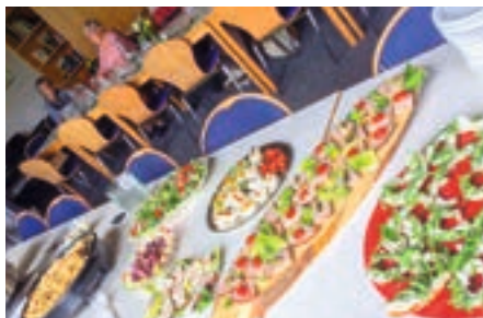
Buffet mit hausgemachten Speisen

jeweils freitags von 11.00 – 13.00 Uhr im Senioren-Café. Anmeldung in Geschäftsstelle, Fahrdienst möglich. Genießen Sie in netter Gesellschaft unser Buffet.