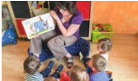
Kinder bei der Tagesmutter

Betreuungszeiten von 8.15 – 11.30 Uhr am Dienstag, Mittwoch und Donnerstag Betreuung von Kindern ab 2 Jahren (Grundschule Parksiedlung) Pfingstferien vom 17. – 21.6.2019