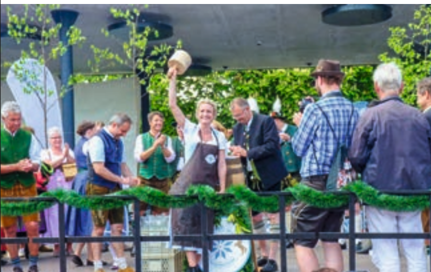
Die bayerische Bierkönigin nach dem Anstich