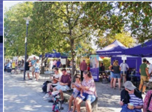
... und Feier- und Marktstimmung bei „Dahoam im Landkreis München“ am 14.07.2024

Bekanntmachungen und Mitteilungen der Gemeinde Oberschleißheim mit den Gemeindeteilen Badersfeld, Mittenheim, Lustheim, Hochmutting und Kreuzstraße