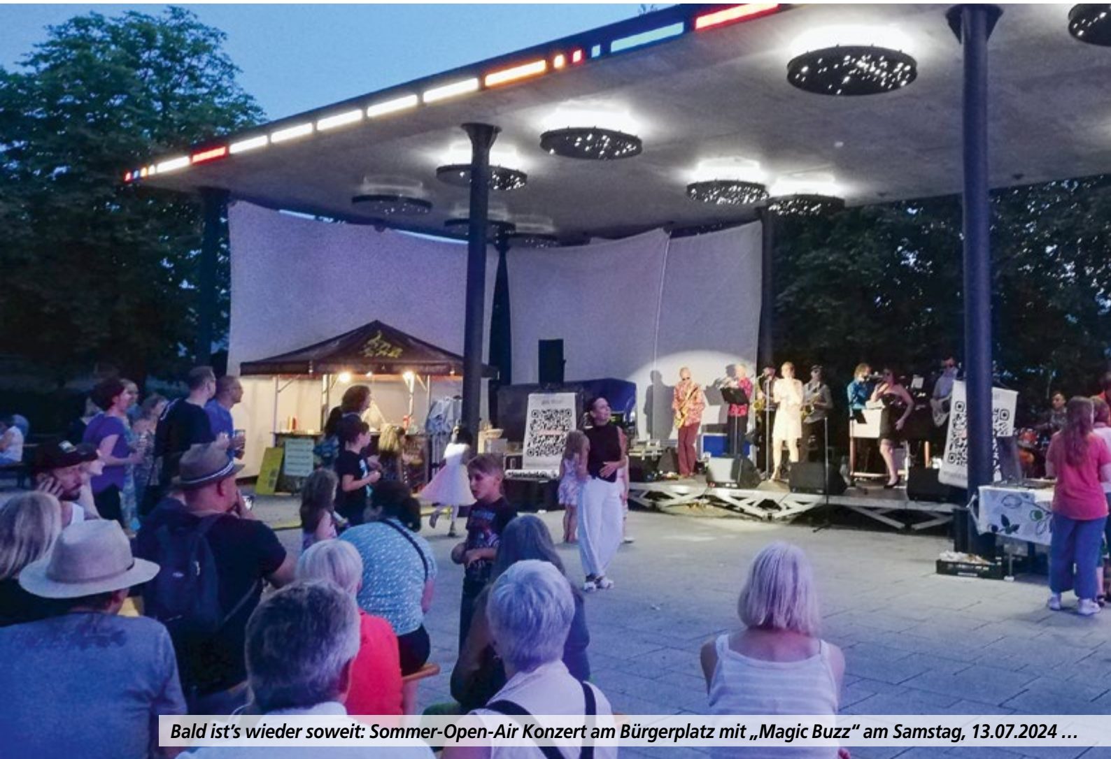
Bald ist's wieder soweit: Sommer-Open-Air Konzert am Bürgerplatz mit „Magic Buzz“ am Samstag, 13.07.2024 ...