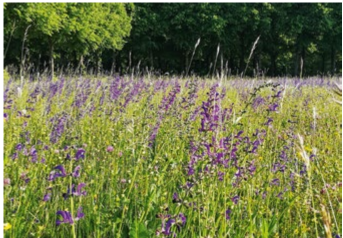
Blumenwiese im Schlosspark

Schließlich sind die Monate Juni und Juli die Zeit der Schulabschlussfeiern und ich gratuliere allen Absolventinnen und Absolventen aus Mittelschule, Therese-Giehse-Realschule und Carl-Orff-Gymnasium auf das herzlichste! Mögen sie einen guten beruflichen Weg einschlagen und sich immer auch für die Gesellschaft – uns alle – engagieren.