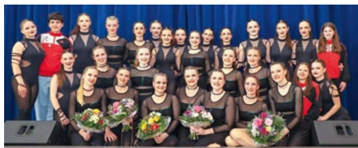
Eine erfolgreiche Matinee 2024

Updates sowie Fotos und Videos gibt es auf dem Instagram Account des TSV Schleißheim unter @jazzada_tvschleissheim! Wer die Gruppen für ein Event oder ähnliches buchen möchte, kann sich gerne auf der Website www.jazzada.de informieren.