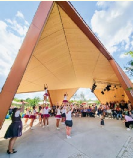
Fetzig wurde es bei den Auftritten von Funkverkehr und der Schmankerlgarde der Narhalla Oberschleißheim, die im Park-Pavillon ihr Können zeigte.