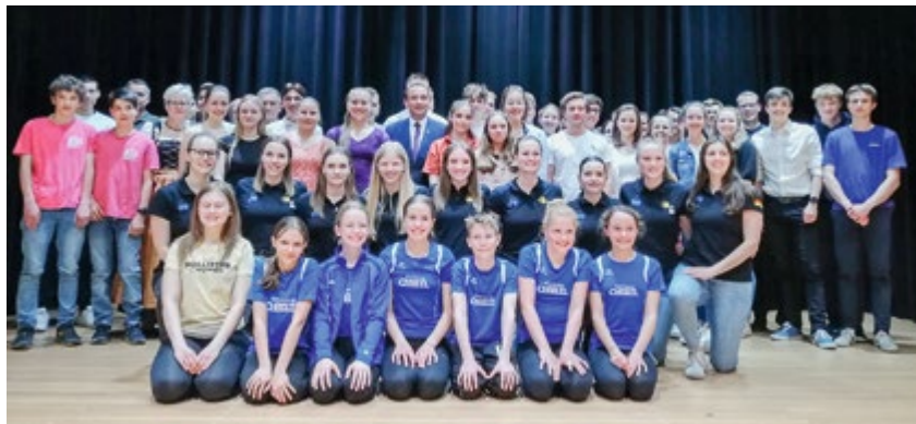
Bürgermeister Markus Böck im Kreise der geehrten Sportler*innen

„Wer regelmäßig die Zeitung liest, weiß es: Oberschleißheimer Sportler sind spitze! Ich bin sehr stolz auf Ihre großartigen Leistungen auf regionaler, nationaler und z.T. sogar internationaler Ebene!“, freute sich Bürgermeister Markus Böck bei der diesjährigen Sportlerehrung der Gemeinde am 25.05.2023. Der Bürgersaal war bei der Ehrung – nach den Coronajahren – endlich wieder gut gefüllt. Die Erfolge können sich sehen lassen: 61 Sportler*innen und 3 Mannschaften aus acht Vereinen haben insgesamt 117 Platzierungen bei Oberbayerischen, Bayerischen, Deutschen und Europa- und Weltmeisterschaften erzielt. Diese Sportler sowie vier verdiente Sportfunktionäre aus den Vereinen konnte Bürgermeister Markus Böck mit Urkunden und einem Präsent auszeichnen.