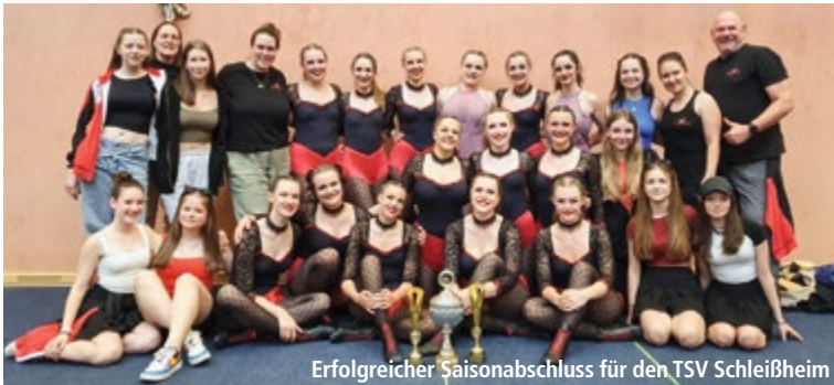
Erfolgreicher Saisonabschluss für den TSV Schleißheim