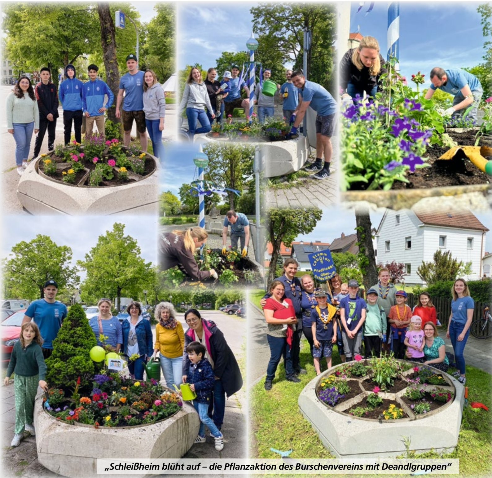
„Schleißheim blüht auf – die Pflanzaktion des Burschenvereins mit Deandlgruppen“

Bekanntmachungen und Mitteilungen der Gemeinde Oberschleißheim mit den Gemeindeteilen Badersfeld, Mittenheim, Lustheim, Hochmutting und Kreuzstraße