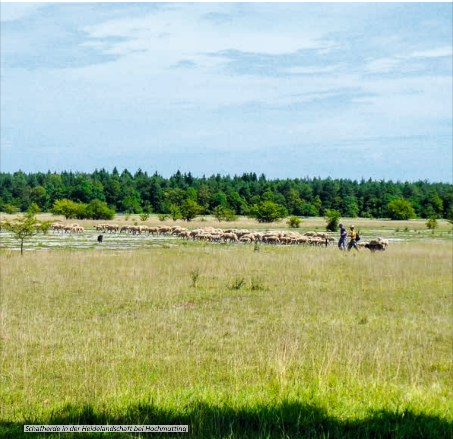
Schafherde in der Heidelandschaft bei Hochmutting

Bekanntmachungen und Mitteilungen der Gemeinde Oberschleißheim mit den Gemeindeteilen Badersfeld, Mittenheim, Lustheim, Hochmutting und Kreuzstraße