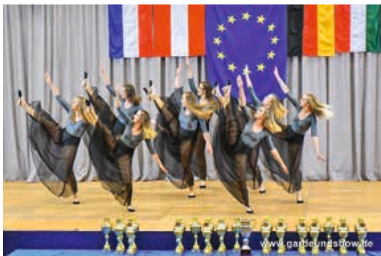
JazzADa's Jazz No.I künstlerisch

Nach diesem spannenden Saisonfinale stehen bereits übergangslos die Reper-toirearbeit sowie die Vorbereitung für diverse Auftritte und die Soiree im Herbst an. Und auch im Tanzsport gilt: „Nach der Saison ist vor der Saison“.