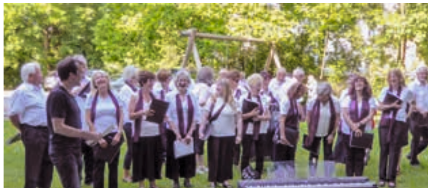
Ausgelassene Stimmung herrschte beim Gesangverein Germania nach dem Auftritt.

Im Rahmen des Schleißheimer Musiksommers trat der Gesangverein Germania am Mittwoch, 5. Juni im Bennohof auf. Gesungen wurden unter anderem Lieder von Abba, Leonard Cohen und Reinhard Mey. Es gab viel Beifall für den Gesangverein, dem es auch viel Spaß gemacht hat.