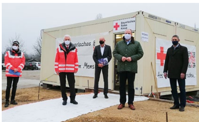
Landrat Christoph Göbel und Unterschleißheims Bürgermeister Christoph Böck bei der Vorstellung des Impfzentrums am Volksfestplatz

Aktuelle Informationen zum Betriebsbeginn erfahren Sie aus der Presse sowie tagesaktuell auf www.oberschleissheim.de/corona .