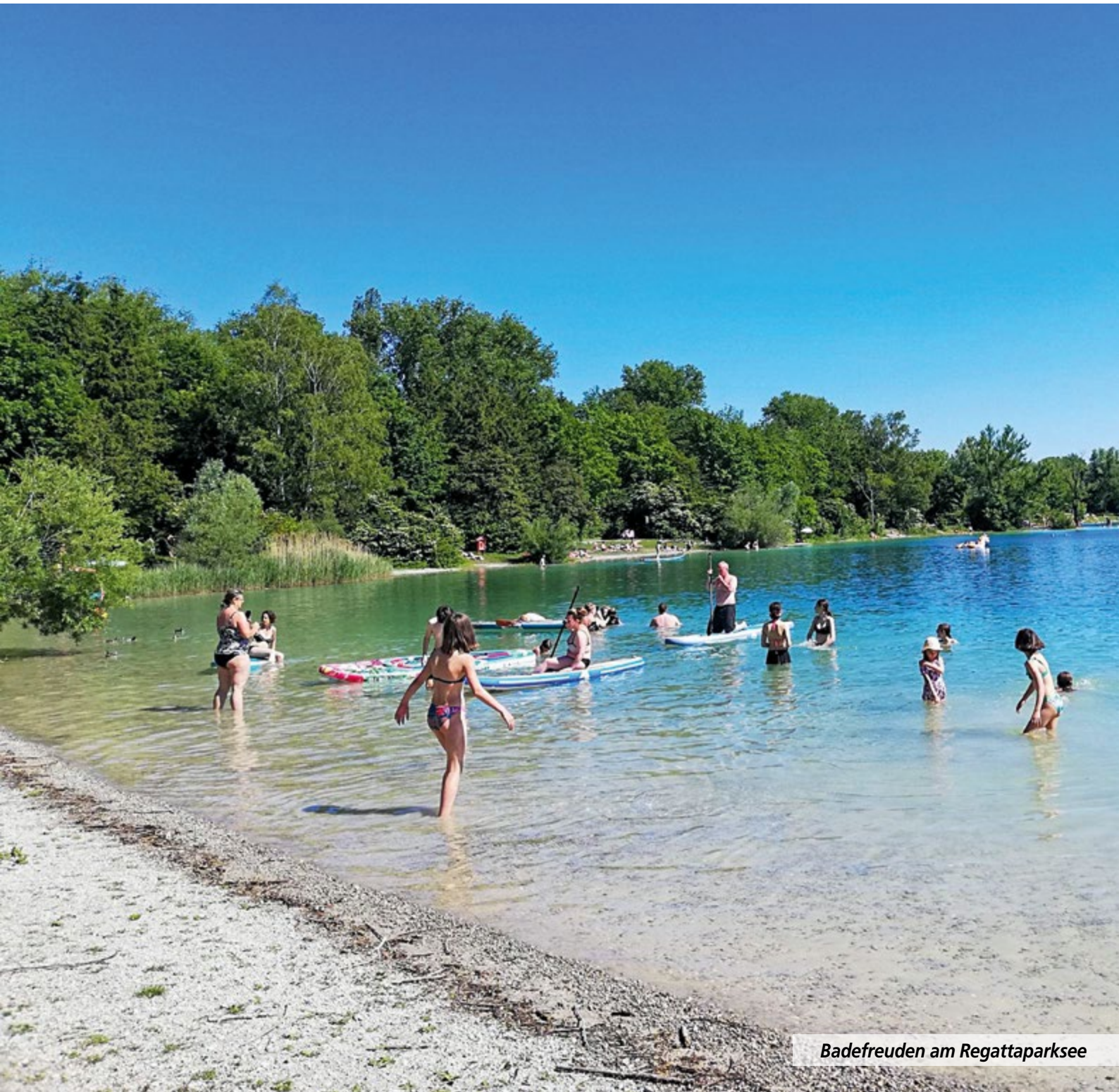
Badefreuden am Regattaparksee

Bekanntmachungen und Mitteilungen der Gemeinde Oberschleißheim mit den Gemeindeteilen Badersfeld, Mittenheim, Lustheim, Hochmutting und Kreuzstraße