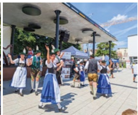
Open Air mit Magic Buzz – Stadtkapelle Unterschleißheim und „Birkenstoana“ bei „Dahoam im Landkreis München“

In diesem Sinne wünsche ich Ihnen – mit Eindrücken vom Open Air mit Magic Buzz und „Dahoam im Landkreis München“ im Juli auf dem Bürgerplatz – einen wunderschönen Urlaubsmonat August!