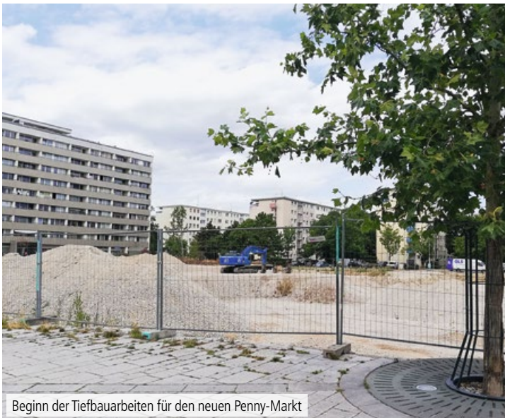
Beginn der Tiefbauarbeiten für den neuen Penny-Markt