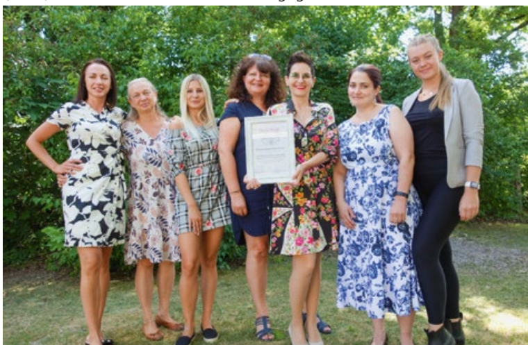
Das Team der Kinderkrippe Mäusenest freut sich über die Anerkennung zur Reggio-inspirierten Einrichtung

Reggio-Pädagogik entstand in Reggio Emilia (Norditalien) und ist laut UNESCO (1991) die weltbeste vorschulische Pädagogik.