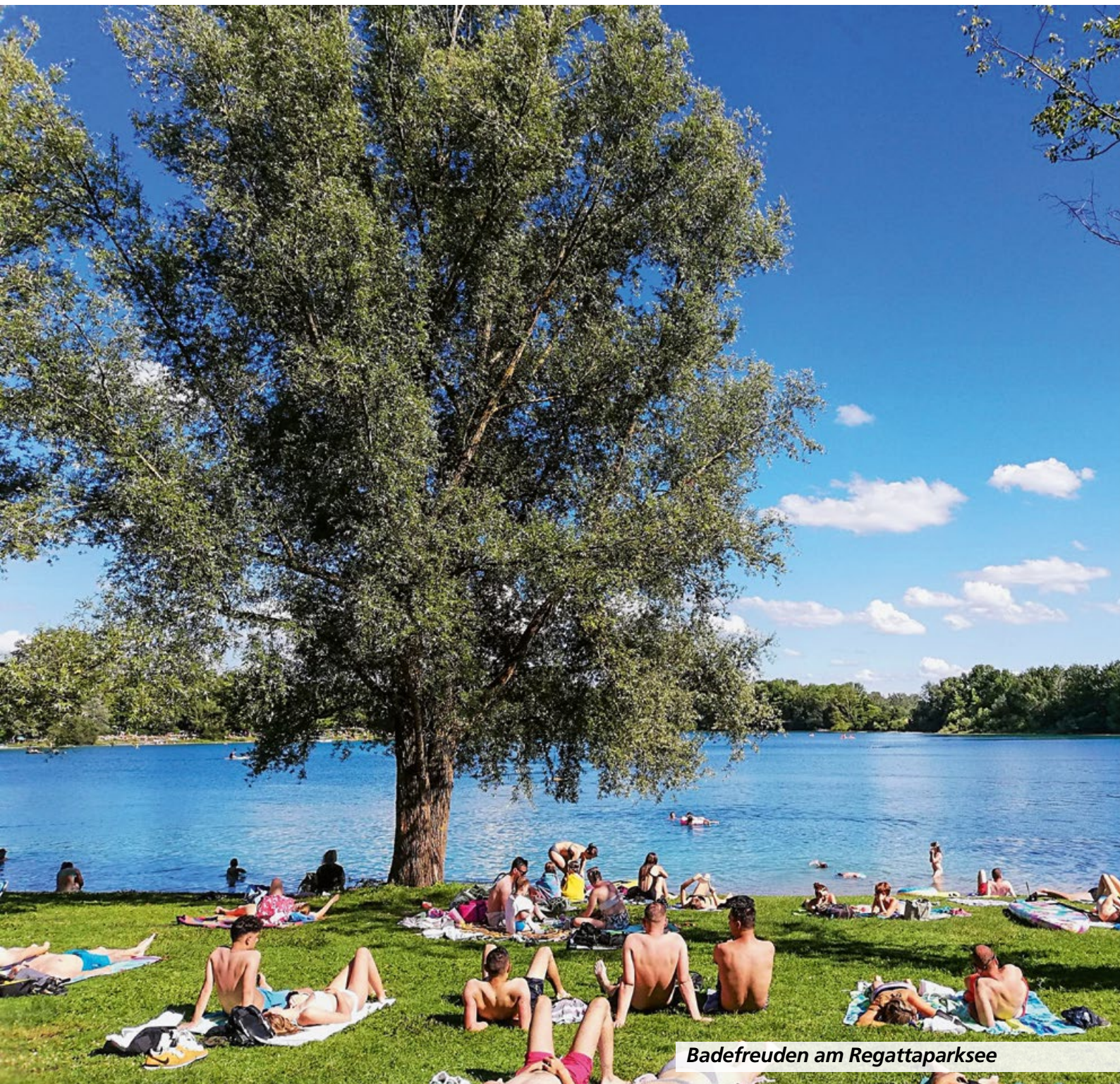
Badefreuden am Regattaparksee

Bekanntmachungen und Mitteilungen der Gemeinde Oberschleißheim mit den Gemeindeteilen Badersfeld, Mittenheim, Lustheim, Hochmutting und Kreuzstraße