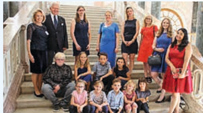
Unter den Preisträgern des Lions Club Wettbewerbs „Jugend engagiert sich“: Der Kindergarten Maria Patrona Bavariae.

Mit unserer einzigartigen Vorstellung und der damit verbundenen Spende haben wir uns beim Lions Club-Projekt „Jugend engagiert sich“ beworben und gewonnen. Für die Kinder ist dies ein besonderes Dankeschön und ein Ansporn, weiterhin Möglichkeiten wahrzunehmen, anderen zu helfen.