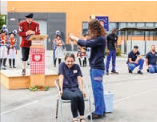
Vorbereitung vor dem Tauchgang: ein nasser Schwamm für die Azubis

Ab ins kühle Nass: Die Schreiner Group, ein internationales Hightech-Unternehmen aus Oberschleißheim mit rund 1.100 Mitarbeitern, feierte am Freitag, den 19. Juli 2019, die alljährliche Gautschfeier.