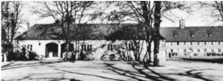
Hauptwache an der Effnerstraße. Rechts im Hintergrund ein Teil der Kommandantur.