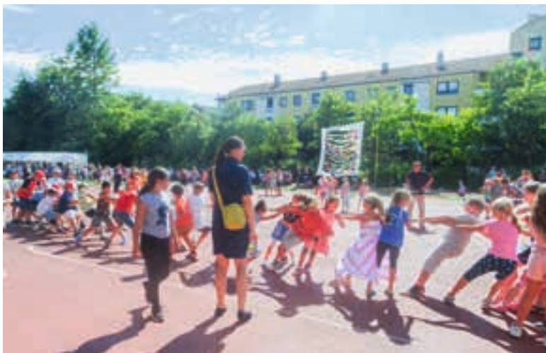
Spiel- und Sonnenstimmung auf dem Sommerfest 2019 der Grundschule in der Parksiedlung

Beindruckende Tanz- und Sportdarbietungen der Narrhalla Oberschleißheim e.V. und des Radsportvereins Schleißheim (RSV) rundeten das Programm ab.