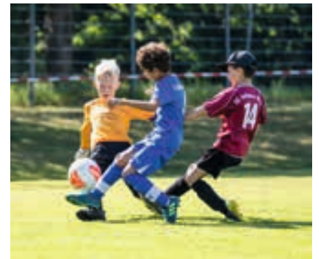
Auch am Festwochenende gab es noch jede Menge spannender Fußballspiele; im Bild die jüngsten Spieler beim Turnier.

Ein besonderer Dank gilt allen Organisatoren und Unterstützern, die dieses tolle Festwochenende möglich gemacht haben. Bei diesem Engagement kann der FC Phönix Schleißheim mit Zuversicht in die nächsten 100 Jahre blicken!