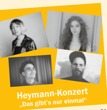
Heymann-Konzert „Das gibt’s nur einmal“

Im C3 Konferenzzentrum, Donnerstag, 7. Mai, 19.30 Uhr