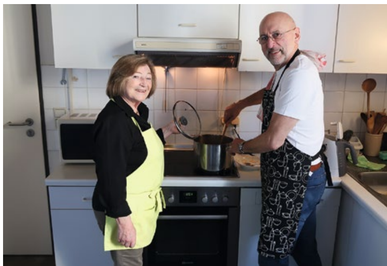
Eines unserer Kochteams am Mittwoch

Werfen Sie doch bei Gelegenheit einen Blick auf den aktuellen Speiseplan in unserem Schaukasten an der Theodor-Heuss-Str. 29, holen sich dann im Büro der Nachbarschaftshilfe einen kostenlosen „Schnuppergutschein“, melden sich an und lassen es sich einfach schmecken! Unsere Kochteams freuen sich auf Sie!