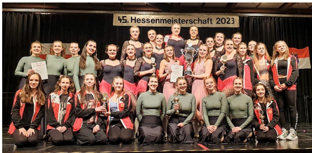
Erfolgreiches Turnier für die Mädels des TSV Schleißheim

Neu war in diesem Jahr die Teilnahme der „Youngstars“: Diese Gruppe trifft sich eigentlich nur zum reinen, sportlichen Vergnügen, doch in dieser Saison wollten auch sie einmal die Wettkampfluft schnuppern. So gab es für die Mädels bei der Bayerischen Meisterschaft nach ihrem Auftritt zum ersten Mal nicht nur Applaus, sondern auch eine Punktwertung. Und so fuhrten sie kurzerhand auch noch zur Hessenmeisterschaft und konnten auch dort ihr gutes Niveau beibehalten.