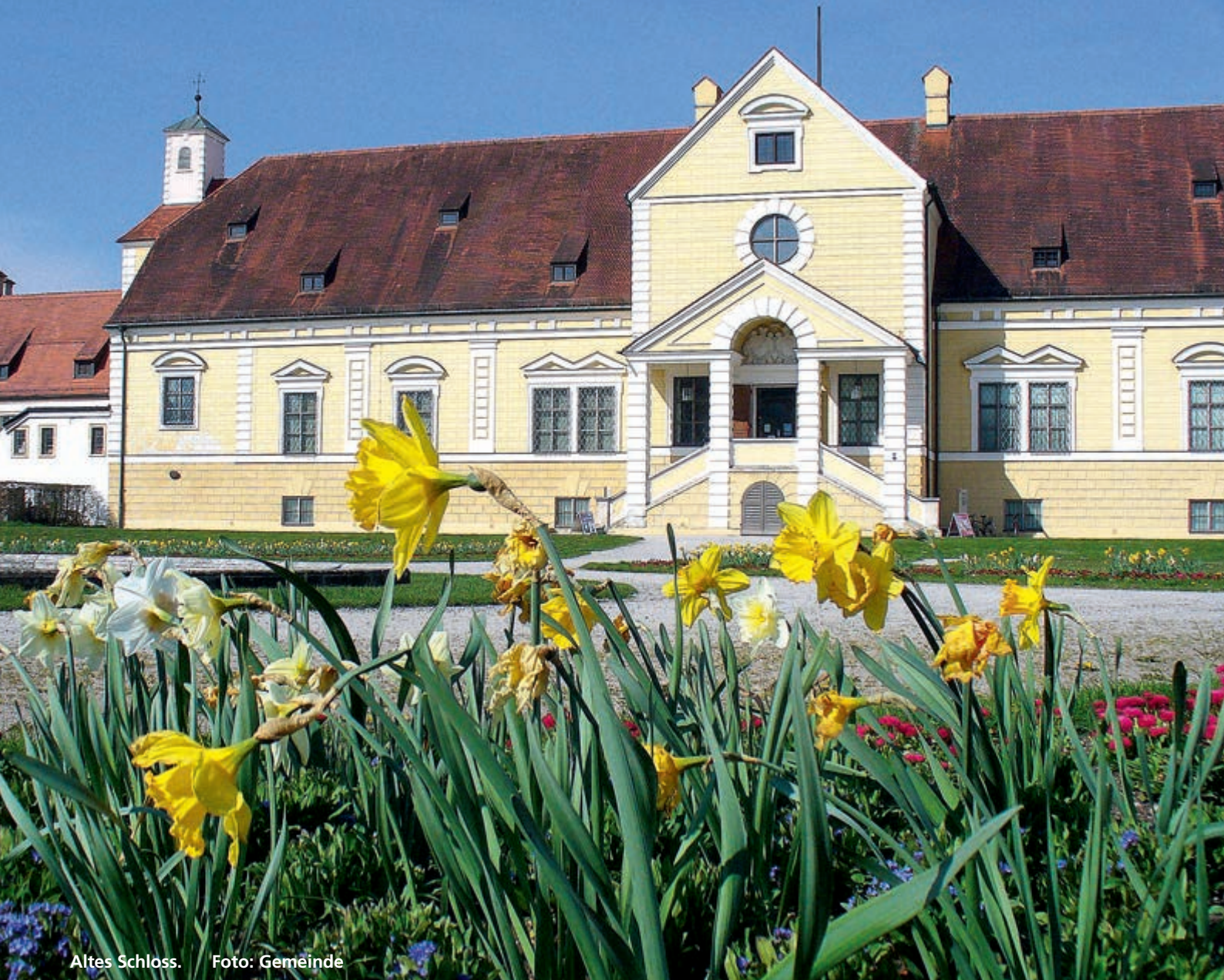
Altes Schloss.