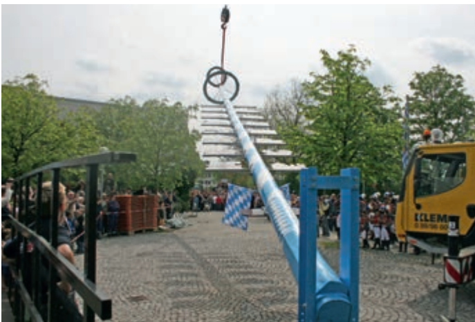
Aufstellen eines nach oberbayrischer Tradition gestalteten Maibaums

Wir, der Verein der Freiwilligen Feuerwehr Oberschleißheim, würden uns freuen, wenn Sie wieder zahlreich unsere Gäste sind und diese alte Tradition bayerischen Brauchtums mit uns zusammen feiern.