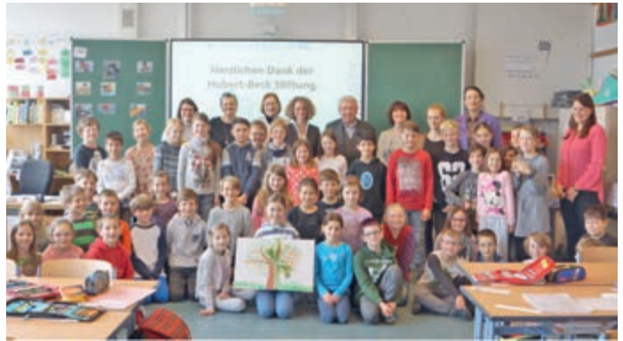
Herr Herzog von der Hubert-Beck-Stiftung inmitten der Schüler der Klassen 3b und 4b.

nicht enthalten wären. Die Gemeinschaftsarbeit der Grundschüler – ein herrlich bunter Frühlingsbaum – wird in Zukunft das stiftungseigene Bürogebäude schmücken.