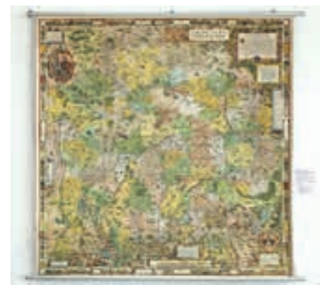
Ältestes Ausstellungsstück: Die Apian-Karte aus dem Jahr 1568 als (Nach-)Druck aus dem 19. Jahrhundert