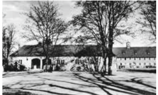
Hauptwache des Luftwaffen-Fliegerhorstes Schleißheim am Südende der Effnerstraße, rechts hinten (das Gebäude mit dem Türmchen) die Kommandantur

Zum Programm des „Schleißheimer Frühlings“ am 13. und 14. April 2019 gehört auch dieses Jahr wieder eine ortsgeschichtliche Radtour. Der Ortschronist Otto Bürger präsentiert auf seinem rd. 1 ½-stündigen Ausflug rund um den Flugplatz: „Schleißheim vor 80 Jahren“. 1939, während der letzten Friedensmonate, bestimmte der Luftwaffen-Fliegerhorst maßgeblich das Ortsgeschehen und die Ortsentwicklung (u.a. Verlegung des Friedhofes, Wohnsiedlungen an der Feierabendstraße und in Mittenheim). Treffpunkt am Samstag, den 13.4., um 14.00 Uhr südlich des Alten Schlosses – neben der Alm. Teilnahmegebühr (plus Infomaterial) pro Person 3 Euro – für Mitglieder des Tourismusvereins und der Freunde von Schleißheim frei!