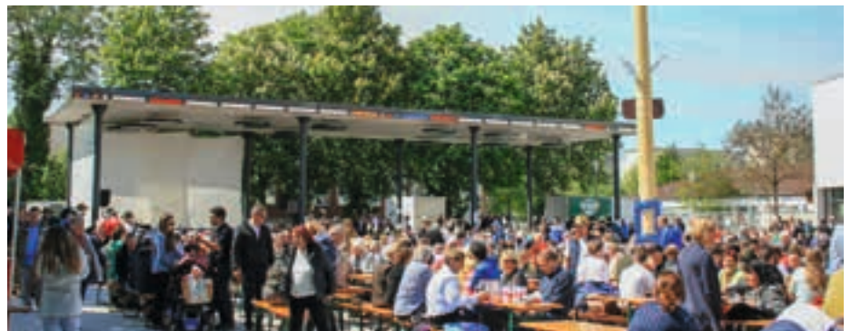
Maifeier am Bürgerplatz (2018)