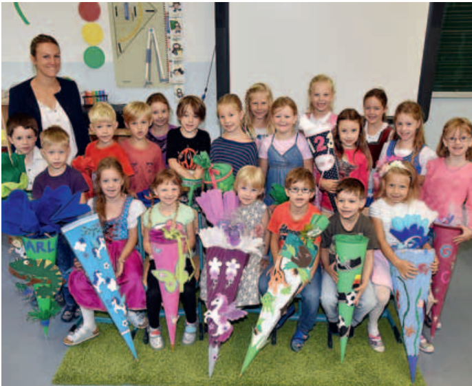
Bergwaldschule, Klasse 1a