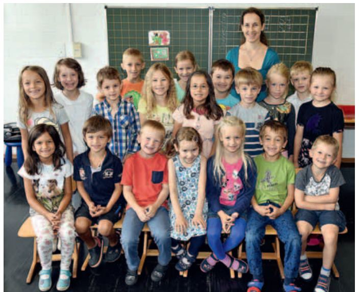
Schule Parksiedlung, Klasse 1d