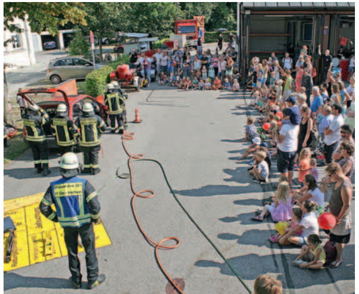
Feuerwehr-Vorführung »Technische Rettung«.

Bei strahlendem Sonnenschein fand in diesem Jahr wieder ein Tag der offenen Tür bei der Freiwilligen Feuerwehr Oberschleißheim statt. Die Besucher konnten sich bei Vorführungen und an Infoständen über die Aufgaben und Tätigkeit der Feuerwehr informieren. Jugend und Aktive zeigten dabei ihr Können. Neben den Grundtätigkeiten, die von der Jugend demonstriert wurden, zeigten praktische Vorführungen die Aufgaben der Höhengsicherungs- und First-Responder-Gruppen, sowie eine technische Rettung.