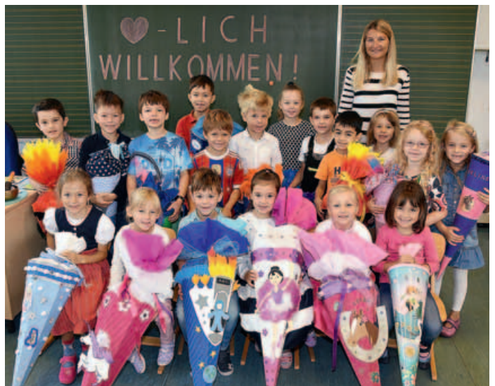
Schule Parksiedlung, Klasse 1b