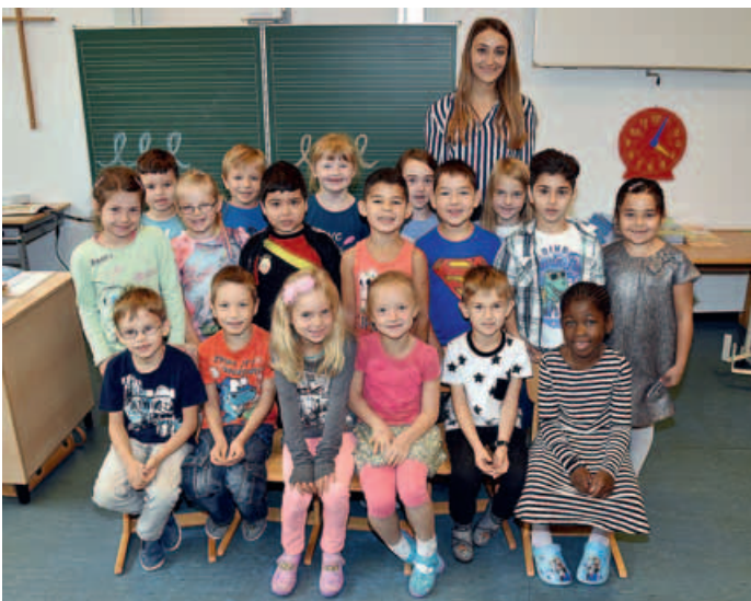
Schule Parksiedlung, Klasse 1a