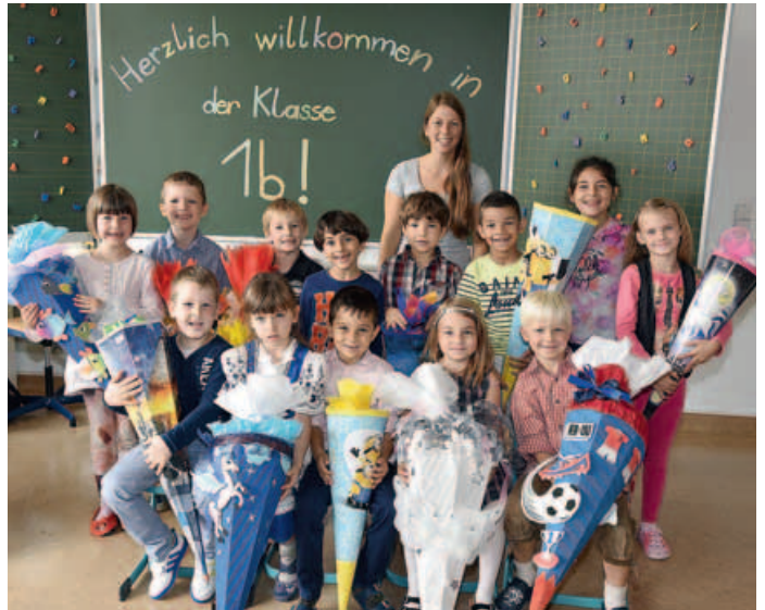
Bergwaldschule, Klasse 1b