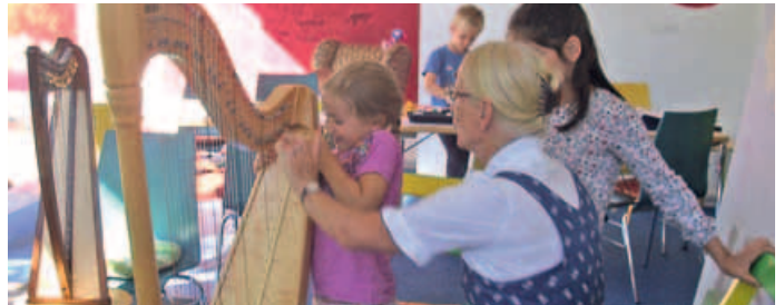
Klang- und Farbwerkstatt für Ferienkinder.