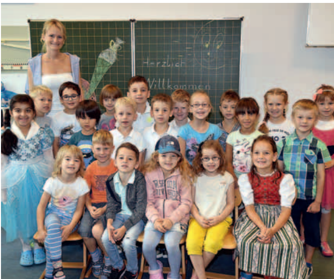
Schule Parksiedlung, Klasse 1c