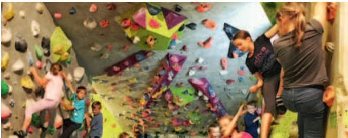
Klettern wie die Affen.