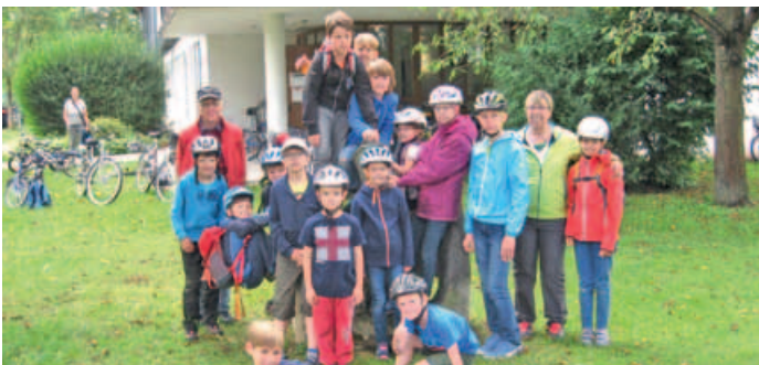
Ferienaktion Besuch in der Vogelklinik.