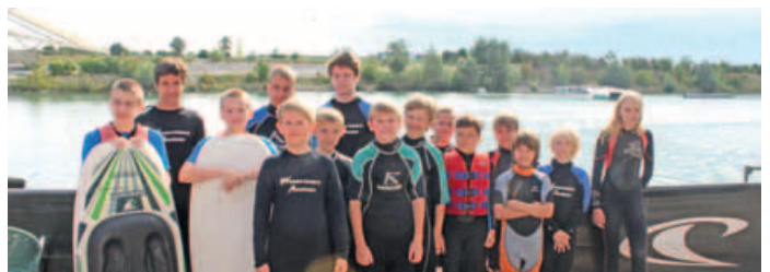
Ausflug in den Wasserskipark.