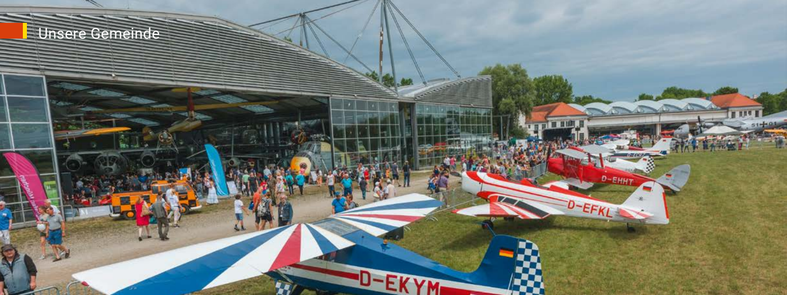
Flugwerft – Fly-in 2017.

sowie einer Brauerei und Käserei wurde für Ackerbau und Viehzucht genutzt, wobei hier von Schafen über Pferde bis zu Büffeln die mannigfaltigsten Züchtungen gehalten wurden.