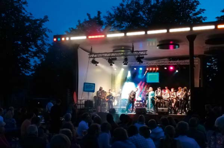
Open Air Konzert am Bürgerplatz