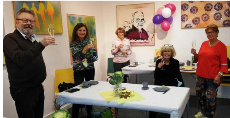
Kaffeetreff im WIR – eine Impression von der 1. (kurzen) Wiedereröffnung nach Corona im Oktober 2020

gemeinsam mit der Agenda-Gruppe Kinder- und Jugendliche jeden Mittwoch von 17.00 bis 21.00 Uhr