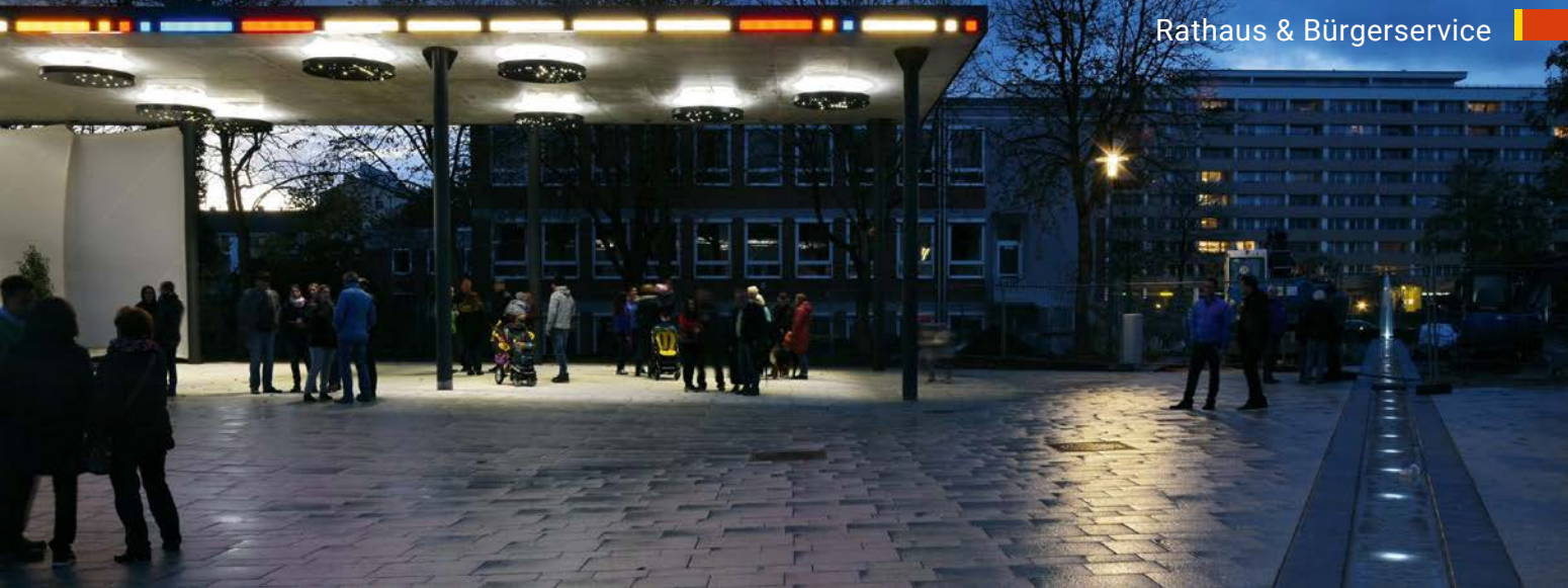
Neuer Bürgerplatz – Lichtkunst am Marktdach