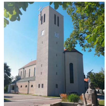
Kirche Maria Patrona Bavariae (MPB)