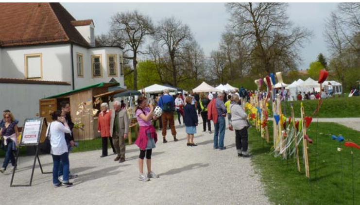
Tourismusverein Schleißheimer Frühling am Alten Schloss

Der Tourismusverein hat große und beliebte Events wie den Schleißheimer Advent und den Schleißheimer Frühling ins Leben gerufen, die unseren Ort in ein hervorragendes Licht rücken und weit über seine Grenzen hinaus bekannt sind.