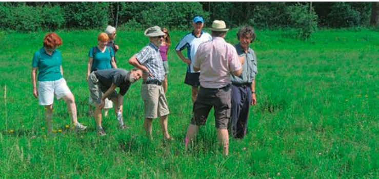
Lokale Agenda 21 auf Exkursion

Alle Veranstaltungen sind abhängig von den jeweils zu dem Zeitpunkt geltenden Regeln zum Infektionsschutz. Bitte erkundigen Sie sich rechtzeitig vorher, ob die Aktionen wie geplant stattfinden.