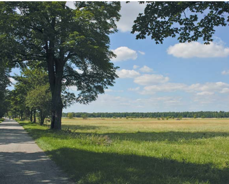
Münchner Allee – mit Blick über die Heide

Herrliche Weite, vielfältige Natur, viele Freizeitstätten direkt vor der Haustür: Nicht nur die Oberschleißheimer Bürgerinnen und Bürger lieben diese Oasen zum Entspannen und Erholen. In nächster Umgebung sind viele Freizeitaktivitäten möglich: Spaziergänge im Schlosspark, Radeln oder Skaten rund um den Flugplatz oder an der Ruderregattastrecke, Baden im Regatta-Badesee, Natur pur auf der Heide oder im Bergwald.