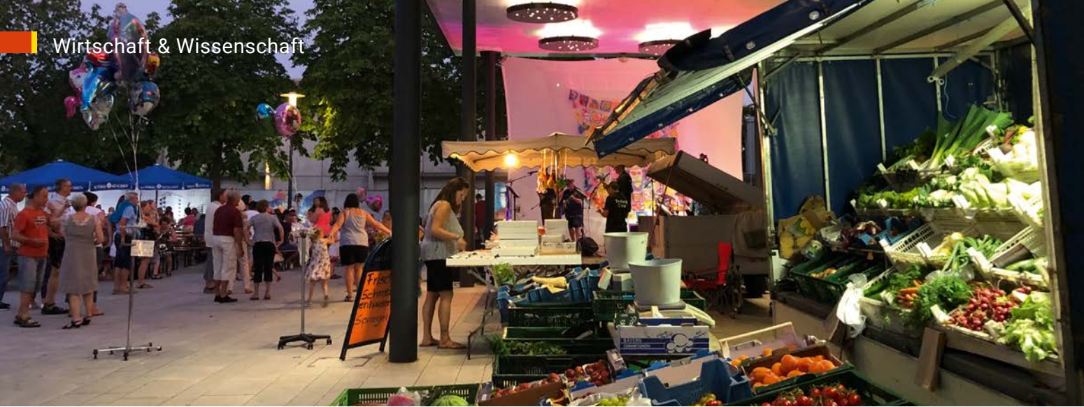
Wochenmarkt – am Feierabendmarkt besonders stimmungsvoll