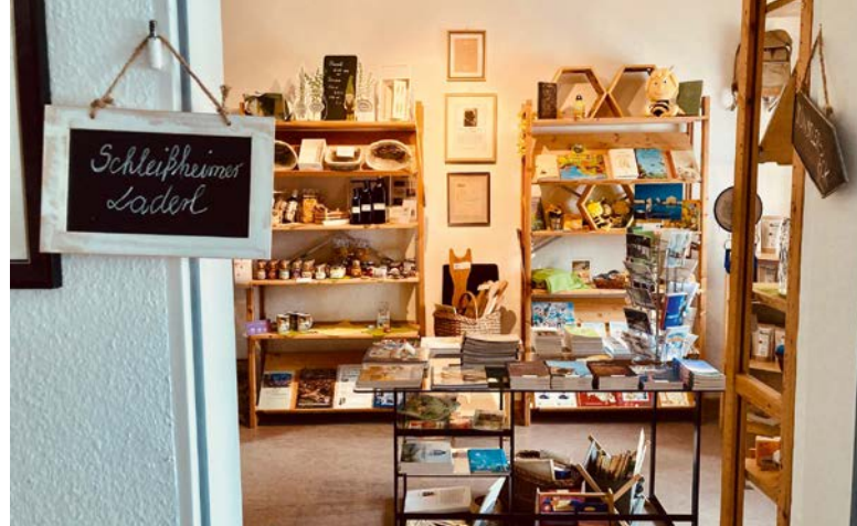
Tourismusbüro mit „Schleißheimer Laderl“