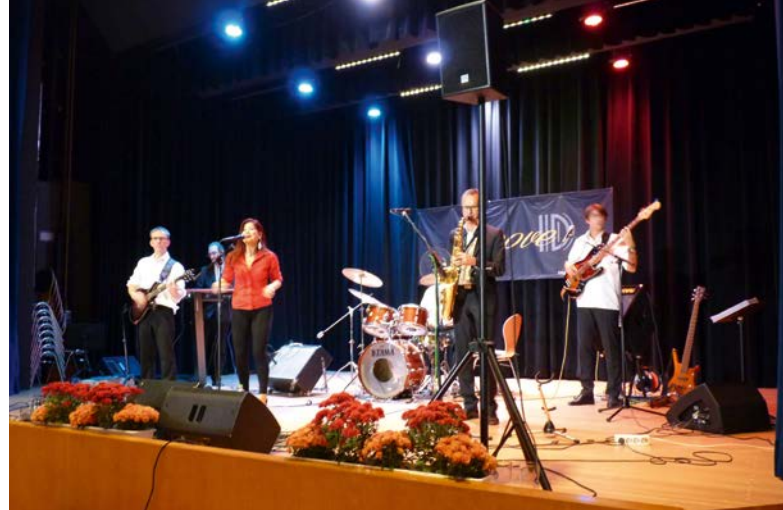
Konzert im Bürgerzentrum