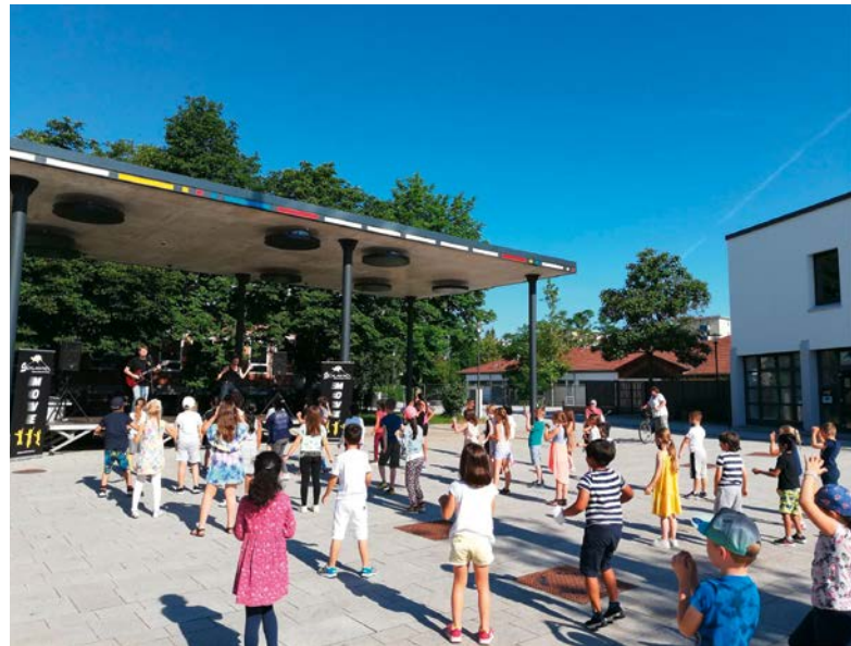
Leben am Bürgerplatz

Ein gutes Miteinander aller Bevölkerungsgruppen hat in Oberschleißheim Tradition. Viele junge Familien sind in den letzten Jahren hierhergezogen und schätzen die guten Betreuungsmöglichkeiten und Schulen und das vielfältige Freizeit- und Sportangebot im Ort, das nicht zuletzt die vielen Vereine anbieten. Kindergärten, Schulen, Gemeinde, Kirchen, Vereine und Verbände arbeiten hier Hand in Hand. Die älteren Bewohner der Gemeinde finden zahlreiche Hilfs- und Beratungsangebote sowie viele Aktionen der örtlichen sozialen Einrichtungen und Vereine. So verwundert es nicht, dass Oberschleißheim auch eine Kommune ist, die sich besonders dem Thema Demenz annimmt und für betroffene Mitbürger und Mitbürgerinnen viel Unterstützung bereithält.