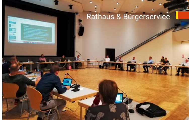
Sitzung des Gemeinderats

hat die kompletten Befugnisse des Gemeinderats und tagt in der Regel einmal während der Sommerferien.